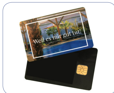
Individuelles Design mit Kontaktchip