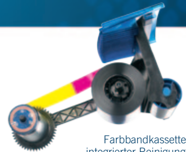
Farbbandkassetten mit integrierter Reinigungsrolle

Flexible Integration: Druckertreiber unterstützt eigene Anwendungen